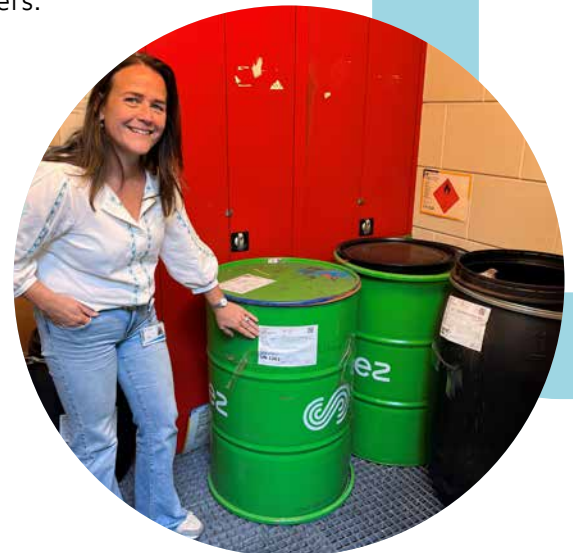
Het afval wordt bijvoorbeeld opgeslagen in deze vaten met duidelijke stickers

Tenslotte moet het vervoer van de stoffen ook veilig gebeuren. Zowel binnen onze gebouwen, als tussen de verschillende locaties. Er zijn eisen voor de vervoermiddelen zelf, zoals ventilatie in de auto's. Ook zijn er regels voor de verpakking waarin de stoffen worden vervoerd en de stickers die erop moeten zitten. Dat geldt ook voor de manier waarop we de stoffen laten afvoeren. Els en Marga weten hoe het moet en helpen zo mee aan een veilige omgeving voor onze cliënten, patiënten en medewerkers.