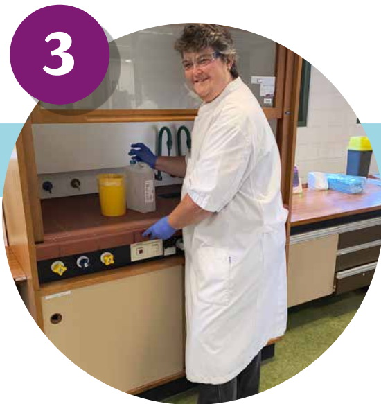
Met onder meer handschoenen en een veiligheidsbril veilig werken in een zuurkast